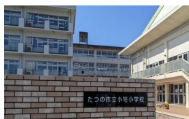
たつの市立小宅小学校 徒歩8分