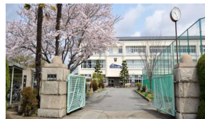
たつの市立龍野東中学校 徒歩15分