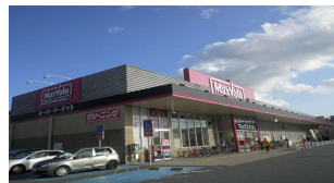
マックスバリュ龍野店 徒歩10分