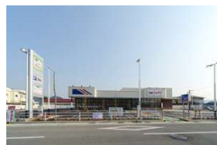
マルアイたつの店