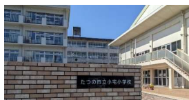
たつの市立小宅小学校